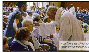
« La force de Dieu agit dans votre faiblesse »

Notre regret reste de n'avoir pas pu suivre dans la sérénité et le recueillement la messe près de la grotte à cause des trombes d'eau de ce jeudi matin ; ainsi que l'annulation du Chemin de Croix sur la montagne, le soir. Mais, nous avons été réconfortés par les paroles de notre évêque « À Lourdes, les grâces sont toujours plus abondantes que la pluie ! ». À la fin de cette semaine vécue dans une ambiance chaleureuse et priante, notre espoir reste d'y revenir un jour.