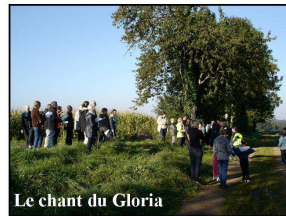
Le chant du Gloria

hauteurs de la Londe, peu après le lieu-dit « la Chaire du Diable », brrr !, le chant du Gloria, et, enfin, près du cimetière de St Pierre d'Entremont où quelques paroissiens nous avaient rejoints à bord de leur voiture, les deux lectures et le psaume.