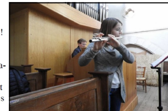
Bravo les artistes ! (sans oublier la chorale et tous ceux qui ont préparé cette cérémonie : fleurissement de l'église, feuilles de chants, etc.)