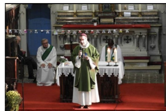
L'homélie : le dimanche des pauvres, la parabole des talents.