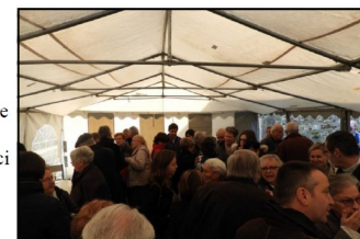
Au cas où... un abri avait été prévu pour le verre de l'amitié, mais il n'a pas plu ! Merci au foot de La Lande !