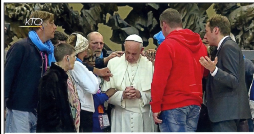
Lors du jubilé des pauvres

Tous ces pauvres exigent l'option fondamentale pour eux. Béniés, les mains qui s'ouvrent pour les secourir. Béniés, les mains qui surmontent les barrières de culture, de religion et de nationalité en versant