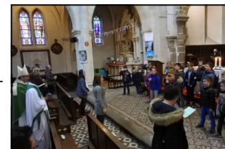
Les enfants ont mimé le chant : « Nous dansons pour notre génération »