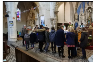
Les enfants viennent de déposer les cartons contenant les dons en nature qui iront au Secours Catholique ou aux Restos du Cœur.