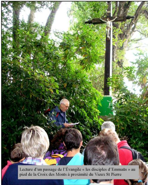
Lecture d'un passage de l'Évangile « les disciples d'Emmaüs » au pied de la Croix des Monts à proximité du Vieux St Pierre

« Dieu a tant aimé le monde qu'Il a donné son Fils Unique. Ainsi tout homme qui croit en lui ne périra pas, mais il obtiendra la